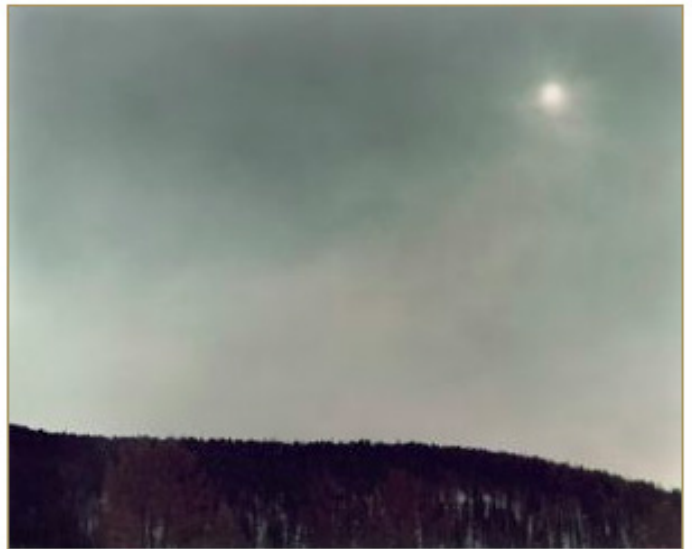
ADAMSKY : MARTINA HOOGLAND IVANOW - SPEEDWAY