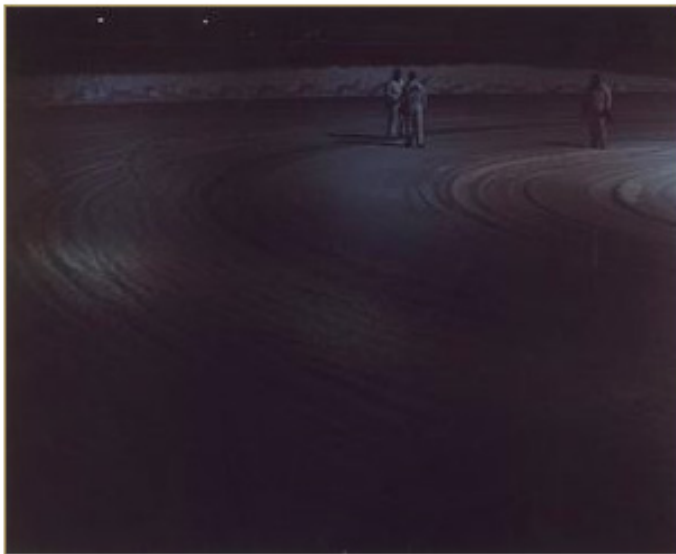
ADAMSKY : MARTINA HOOGLAND IVANOW - SPEEDWAY