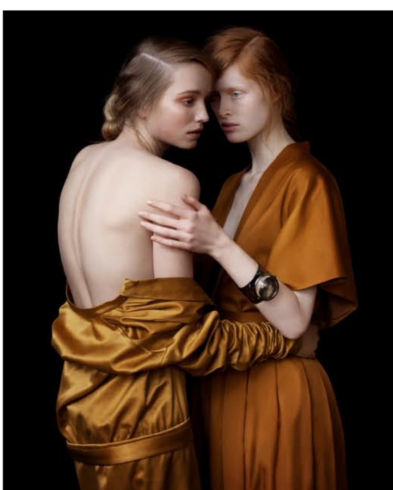
Julia Hetta: Untitled, Size: 94 x 117 cm, Pigment Print, Acid free cotton rag paper

Denise Grünstein verbindet Mode & Kunst mühelos: Mit scheinbarer Leichtigkeit schafft sie in ihren eigenwilligen Fotografien den atmosphärischen Übergang von ihrem eignen künstlerischen Werk zu Auftragsarbeiten. Arbeiten, deren Hauptthemen Frauen und Natur sind. Ihr Spielplatz ist eine sonderbare visuelle Welt, machtvoll und zweideutig.