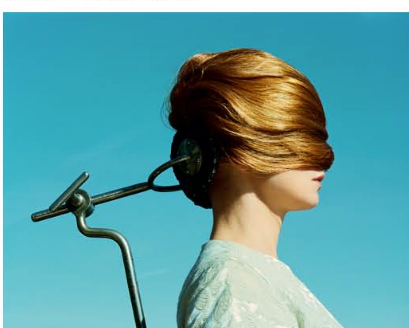
Denise Grünstein: Titel: Headhunter, Size: 123 x 153 cm, C-Print

Swedish Photography Karl-Marx-Allee 62 10243 Berlin-Friedrichshain Vom 8.06 bis 20.07.2013 Mittwochs bis samstags von 12 bis 18 Uhr