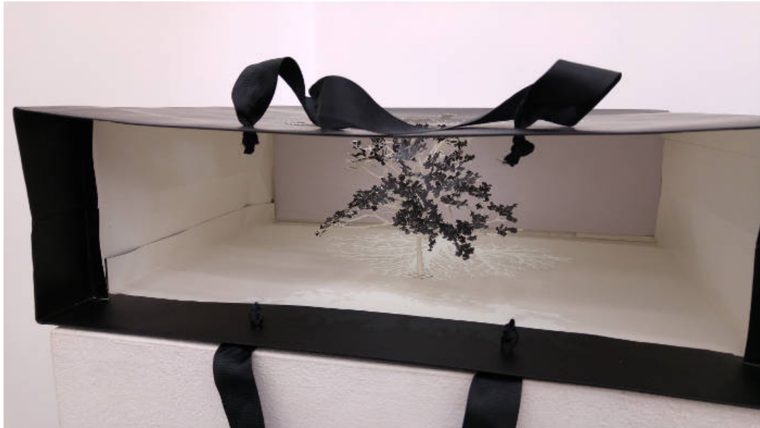
Genom att ljussätta påsarna kan man få fantastiskt fina effekter..

cutoutteknik, blev ett naturligt val, då Yuken inte ville lägga till något i sitt skapande, utan bara forma om materialet, och sluta dess livscykel.